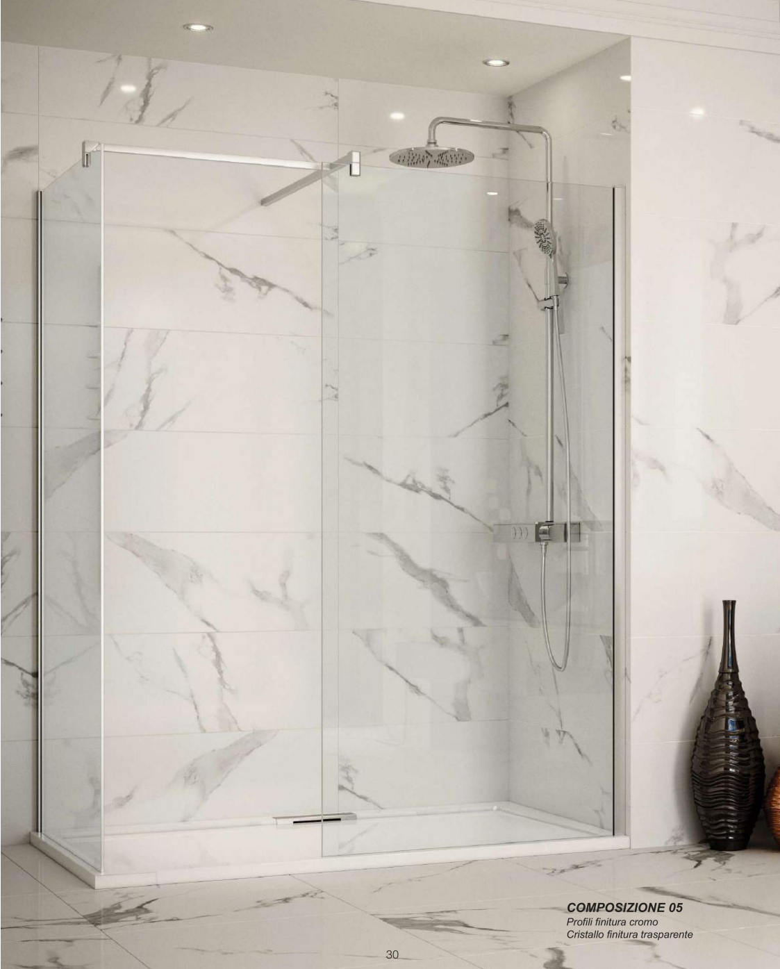
COMPOSIZIONE 05 Profili finitura cromo Cristallo finitura trasparente